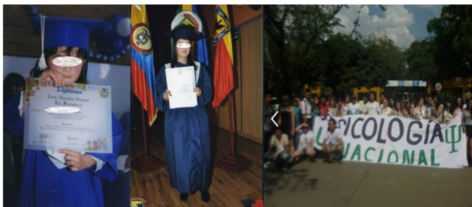
Ilustración 4 Estudiantes desde preescolar a media fortalecida

Teniendo en cuenta la pregunta rectora que motiva esta monografía acerca de las expectativas que explican el ingreso a la universidad de los estudiantes del Colegio Gerardo Paredes en la localidad de Suba; es necesario hacer una aproximación teórica que ofrezca mayor claridad al objeto de la investigación.