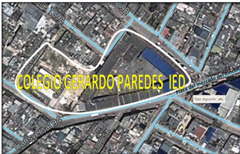
Ilustración 3 Ubicación Colegio Gerardo Paredes IED (sede principal)

El presente trabajo se adelanta en el Colegio Gerardo Paredes Institución Educativa Distrital –IED–, ubicado en la localidad 11 de Suba, en la carrera 94C n.º 129-05 en el barrio Rincón contiguo a la parroquia San Agustín y la plaza de mercado.