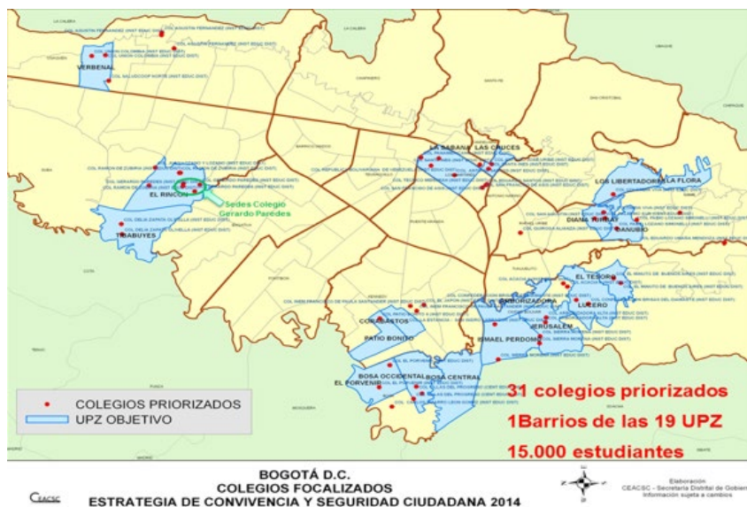
Ilustración 1 Colegios priorizados plan 75cien

El Colegio Gerardo Paredes IED, se encuentra ubicado en la localidad 11 de Suba, específicamente en el barrio Rincón, el cual se encuentra inmerso en una de las zonas de mayor vulnerabilidad de Bogotá según el informe Plan 75cien. Por esta razón, la institución ha sido clasificada entre los 31 colegios de la ciudad de Bogotá que requieren de una atención prioritaria. En el reporte delictivo y factores de riesgo de la