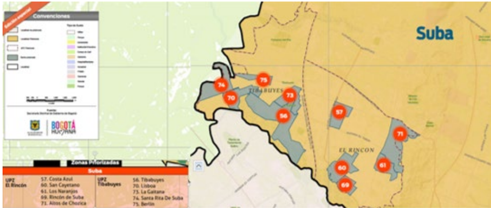
Ilustración 2 Plan 75cien Tibabuyes-Rincón. Estrategia Integral contra la Violencia en Barrios de Bogotá